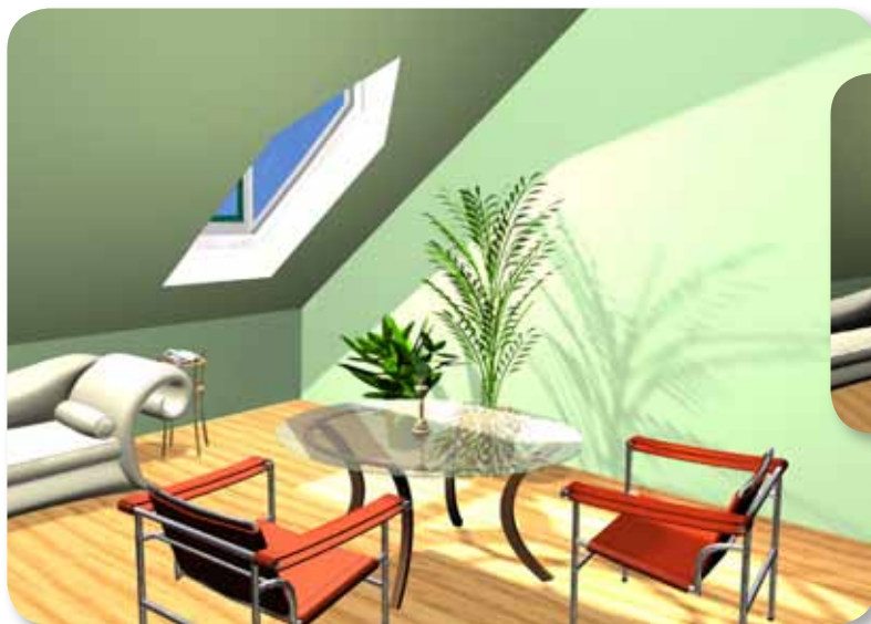
• Ausleuchtung mit einer LUXIA-Gaube