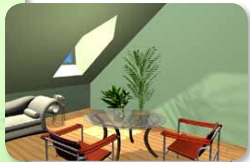
• Ausleuchtung mit einer herkömmlichen Gaube